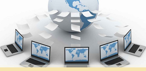
कोअर बँकींग सुविधा