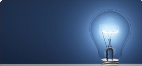
विज बिल भरणा केंद्र