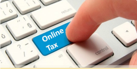
ऑनलाईन टॅक्स सुविधा