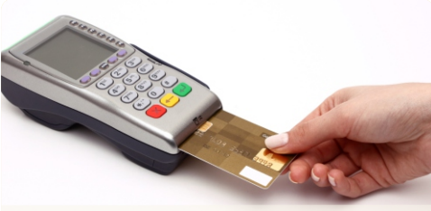
ए.टी.एम. कम डेबीट कार्ड सुविधा