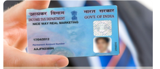
पॅन कार्ड सेवा