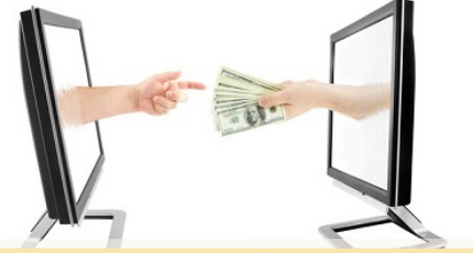
आर.टी.जी.एस. व नेफ्ट सुविधा