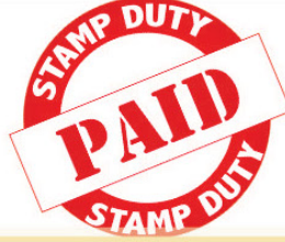
मुद्रांक शुल्क व नोंदणी फी चा भरणा