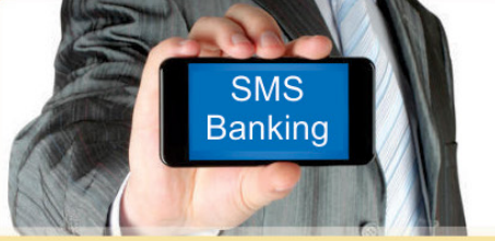
एस.एम.एस. व मोबाईल बँकींग सुविधा