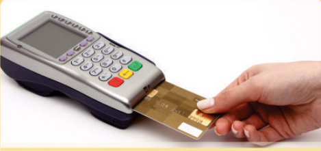
ए.टी.एम. कम डेबीट कार्ड सुविधा