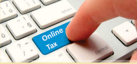
ऑनलाईन टॅक्स सुविधा