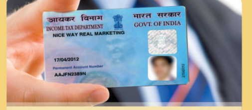
पॅन कार्ड सेवा