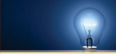
विज बिल भरणा केंद्र