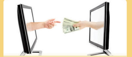
आर.टी.जी.एस. व नेफ्ट सुविधा