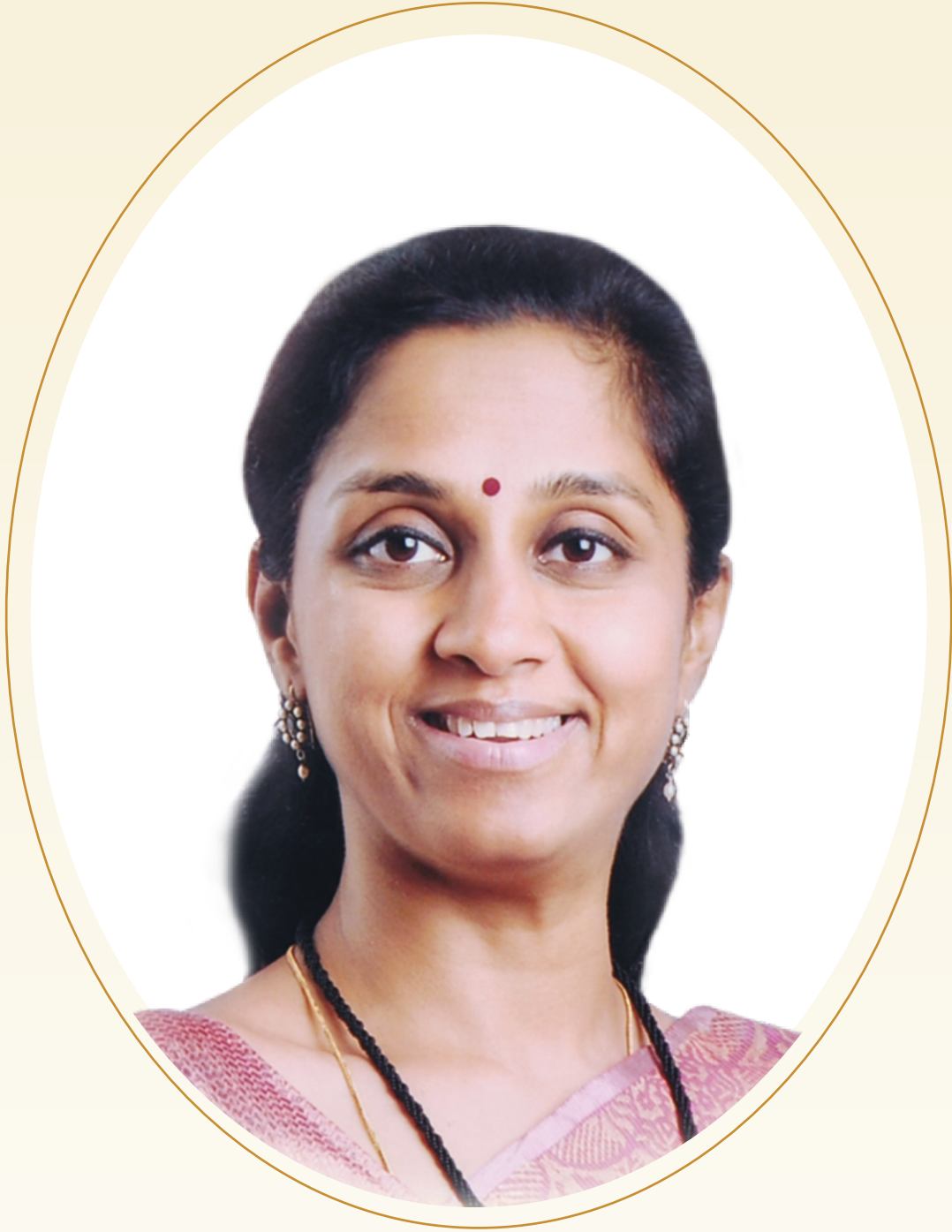
बारामतीचे भूषण संसद महारत्न मा. खा. सौ. सुप्रियाताई सुळे