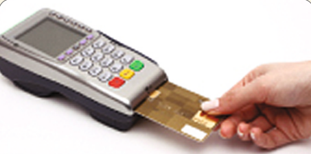
ए.टी.एम. कम डेबीट कार्ड सुविधा