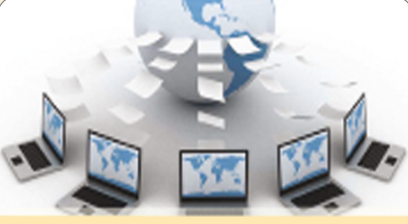
कोअर बँकिंग सुविधा