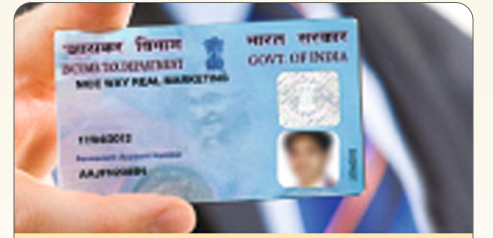
पॅन कार्ड सेवा

एनी ब्रँच बँकिंग / फास्ट ट्रॅक पेमेंट सुविधा / संपूर्ण भारतातील ए.टी.एम. सेंटर्सद्वारे व्यवहार