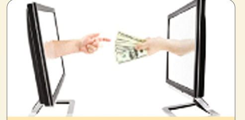
आर. टी.जी.एस. व नेफ्ट सुविधा