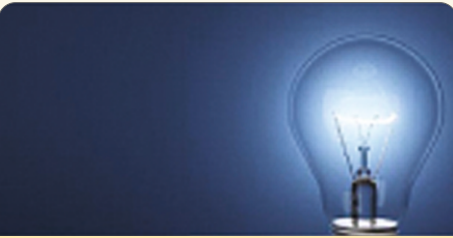
वीज बिल भरणा केंद्र