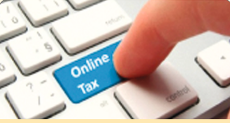
ऑनलाईन टॅक्स सुविधा