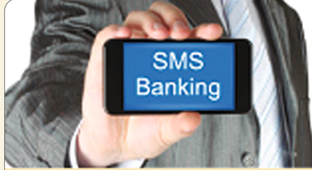
एस. एम. एस. व मोबाईल व बँकिंग सुविधा