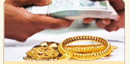
सोने तारण कर्ज